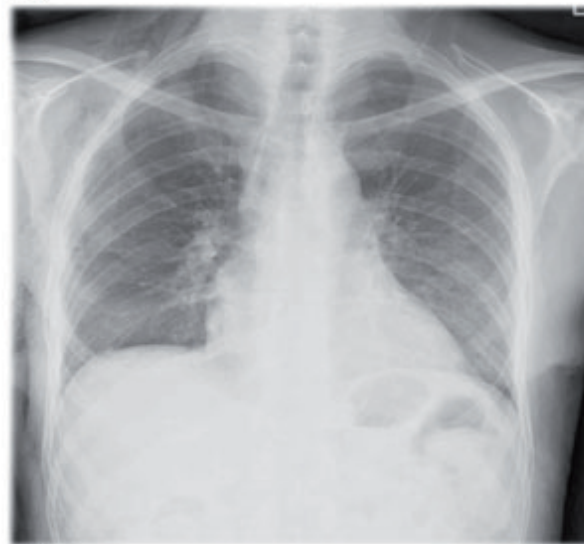
Röntgenaufnahme des Thorax von (A) und nach (B) einer Lungentransplantation wegen ausgeprägter Fibrose